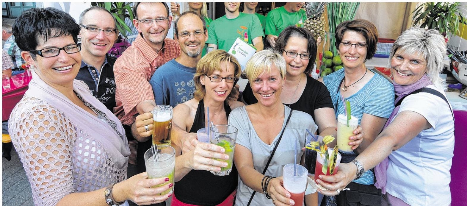
Start in einen Traumabend: Diese Damen und Herren sind seit Jahren Stammgäste

Der musikalische Auftakt mit Pauken und Trompeten durch den Fanfarenzug Blau-Weiß Bochum-Hamme passte da nur zu gut. Bestens gelaunt präsentierten sich auch die Festwirte auf der Bühne.