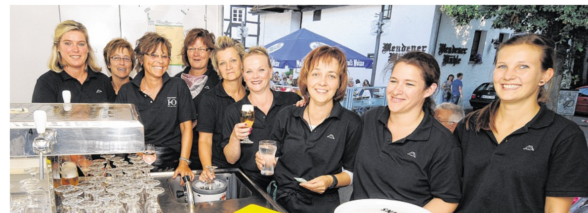
Das Hünnes-Team noch vor dem ersten großen Ansturm am frühen Freitagabend: Gute Laune auch dann, wenn der Trubel später mal sehr groß wurde.