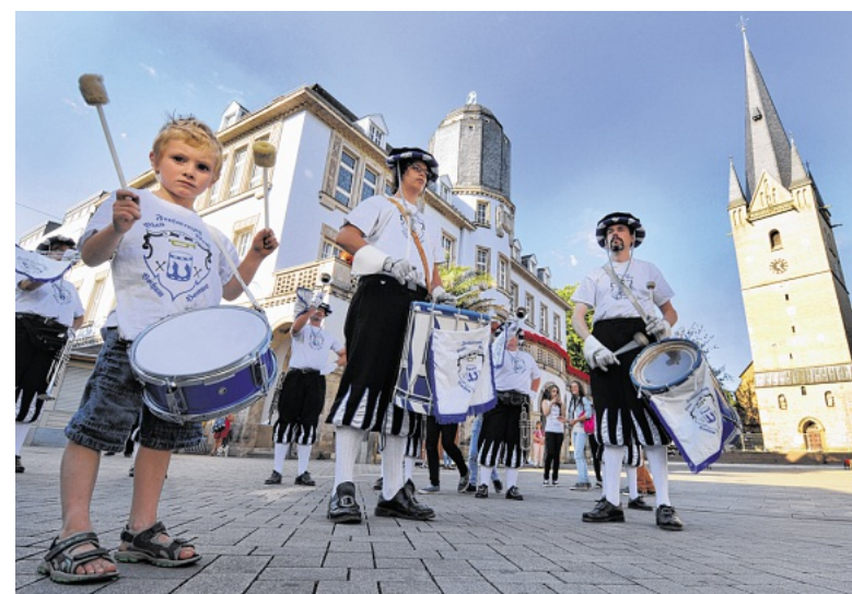
Der Fanfarenzug Blau-Weiß Bochum-Hamme sorgte für einen stimmungsvollen musikalischen Auftakt.